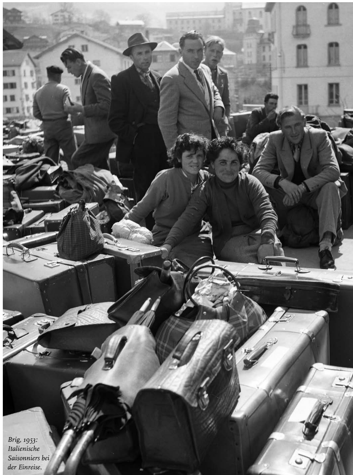
Brig, 1953: Italienische Saisonniers bei der Einreise.

«Wir, Saisonniers...»: Zürich 1931–2026. Eine Ausstellung über sichtbare Arbeit und unsichtbar gemachtes Leben. Photobastei, Sihlquai 125, Zürich, bis 21. Juni. Mittwoch und Sonntag 12 bis 18 Uhr, Donnerstag bis Samstag 12 bis 21 Uhr.