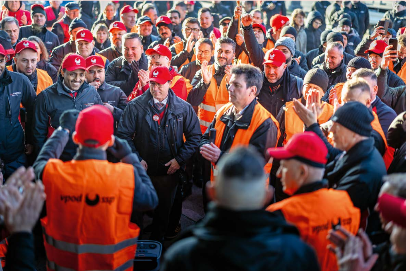
Alle Räder ausser einem kleinen Trottinett stehen still, wenn der starke Gewerkschaftsarm es will.