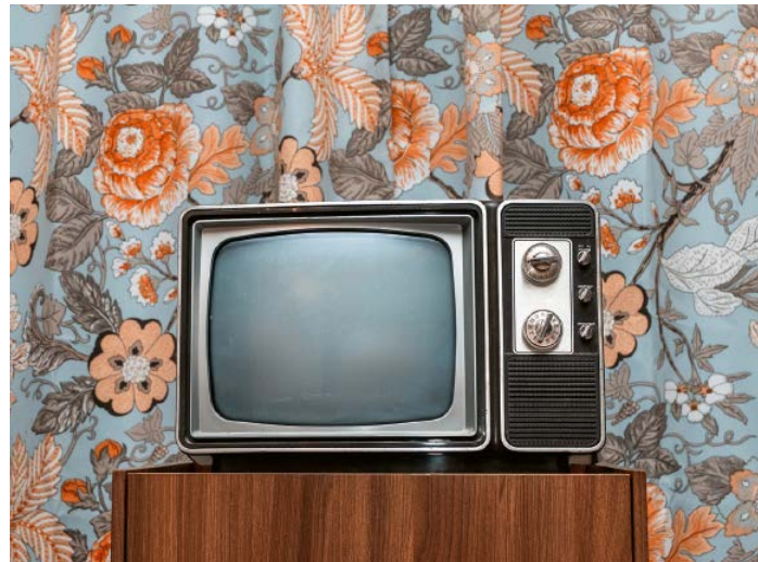
Fernsehen gerettet: Die Ablehnung der Halbierungsinitiative war von erfreulicher Deutlichkeit.

Die Vorlage zur Individualbesteuerung wurde letztlich mit wenig Euphorie angenommen; auch der einstige feministische Support ist weitgehend weggebröckelt, vor allem wegen der mit der Vorlage verbundenen Steuerausfälle. Wäre die Vorlage eine ständemehrpflichtige Initiative gewesen, wäre sie an den konservativen Kleinkantonen gescheitert. Eher irritierend ist, dass der Klimafonds lediglich 29 Prozent Ja-Stimmen machte. Noch nicht einmal Basel-Stadt hiess die Vorlage gut. Die Frage muss erlaubt sein: Wie bitte möchte die Schweiz die ökologische Kurve kriegen, wie dem Klimawandel begegnen, wenn sie per Volksabstimmung die notwendigen Weichen nicht umgestellt bekommt? Ohne massive Investitionen in das Energie- und Mobilitätssystem wird es nicht gehen, ebenso wenig – das betont der SGB besonders – ohne soziale Abfederung. Man wird ein paar Milliarden zusätzlich in die Hand nehmen müssen zugunsten der zu-