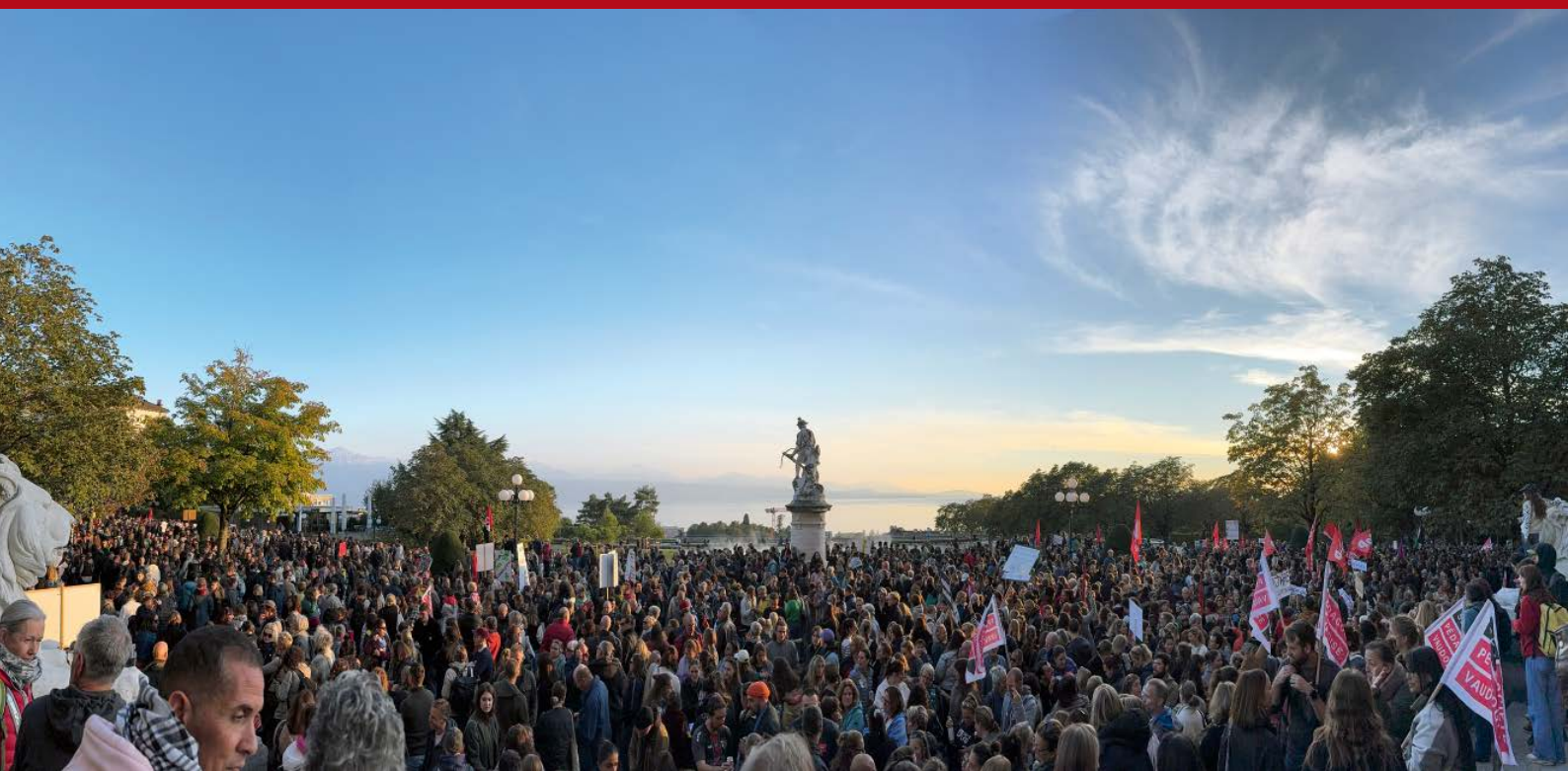
...bis zu 28 000 Leute auf die Strasse.