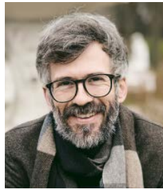
Antonia W. Fleischmann ist eine Figur des Schriftstellers Lukas Linder. Er lebt in Polen und in der Schweiz.

ihrem Abgang drohen. Vielmehr verschwinden sie ganz von alleine. Wer nichts zu befürchten hat, der darf alles wagen. Und wagt doch meistens nichts ausser einem dramatischen Post in den sozialen Netzwerken. Danach kann er ruhig schlafen gehen, weil er weiss, dass er in einer Welt aufwachen wird, die noch genauso aussieht wie am Abend zuvor – ausser dass er ein paar mehr Likes auf dem Konto hat und eine Freundschaftsanfrage von einem gewissen Jean-Jacques Bitterli, Managua, Nicaragua. Das mag etwas ungerecht klingen, zumal von einem Menschen, der die Feigheit für sich gepachtet hat. Der einzige Abgang, mit dem ich drohe, ist mein