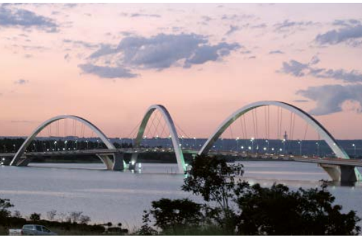
Freihandelsabkommen wie Mercosur – im Bild: Brasilia – müssen den Beschäftigten nützen.