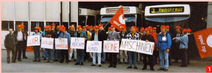
VPOD-Aktionen im Nahverkehr: Streik 1999 in St.Gallen (1), rollende Busblockade 2000 in Luzern (2), Teilstreik 2011 in Zürich (3).

| Text: Christoph Schlatter