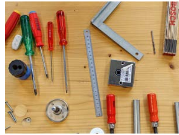
Neu zu arrangieren: Berufe der Hauswartung.

gestaltet – neu positioniert und mutmasslich auch neu benannt. Der Bestandteil «Meister:in» sollte ursprünglich eine Analogie zu traditionellen Gewerbeberufen («Bäckermeister») sein, verfehlt aber seine Wirkung, weil «der Hausmeister» im allgemeinen Verständnis schwächer konnotiert ist. Die Digitalisierung der Arbeitswelt wird sich in den neuen Profilen ebenso niederschlagen wie die gesteigerten Anforderungen an die Ökologie. Für den VPOD ist wichtig, dass die Berufe nicht zu reinen